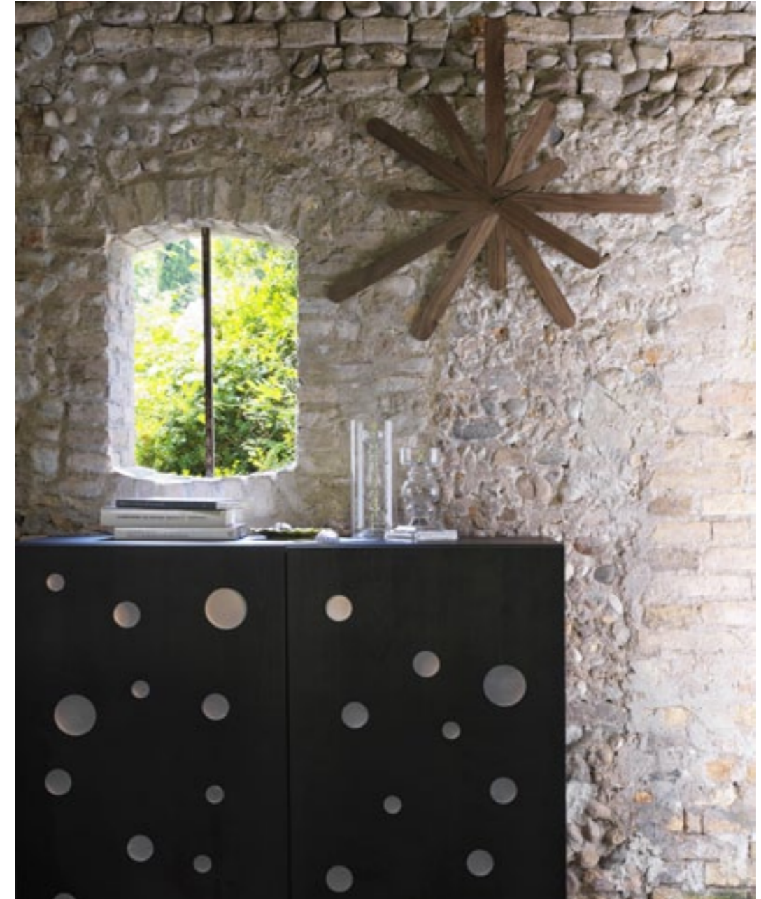
TWIST Appendiabiti / Coat Stand