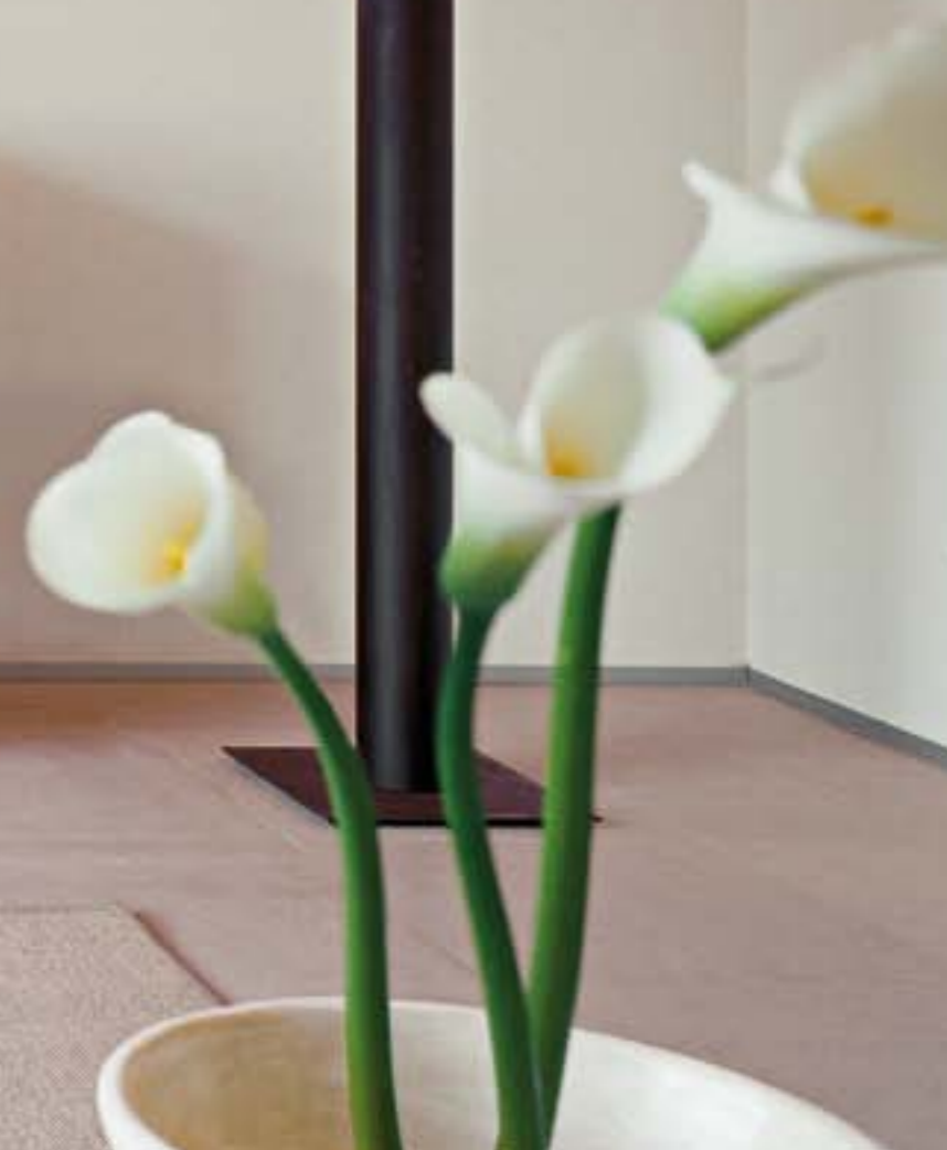
co-starring: RIPPLES panca/bench